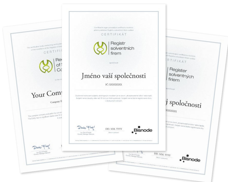
Registr solventních firem Náhled tištěného certifikátu