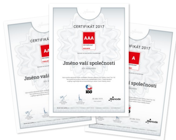
Náhled tištěného certifikátu