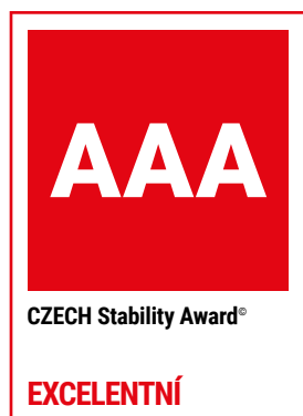
Logo ocenění CZECH Stability Award