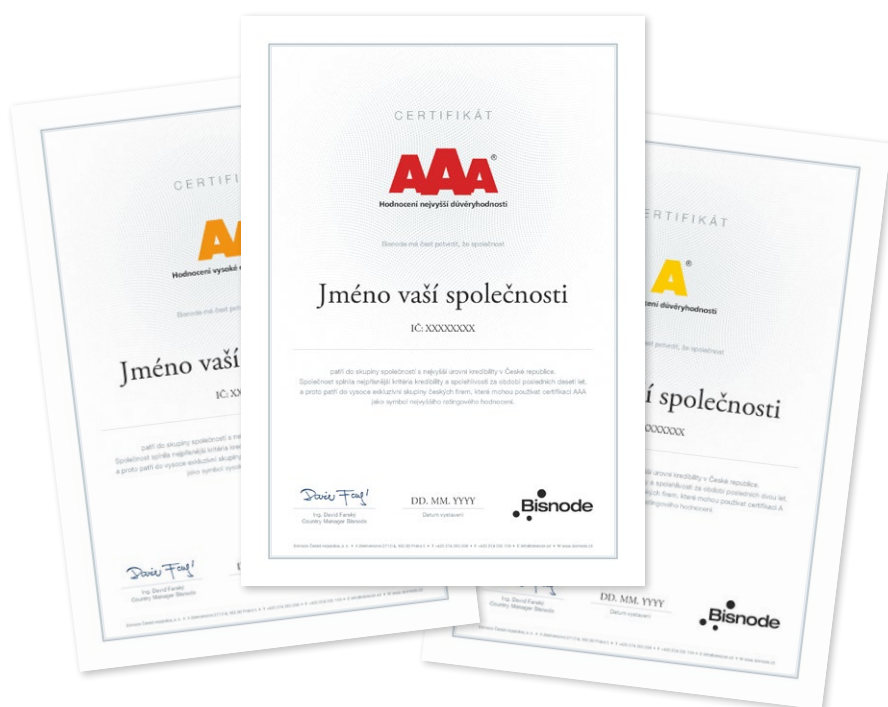
Mezinárodní ocenění AAA, AA, A Náhled tištěného certifikátu