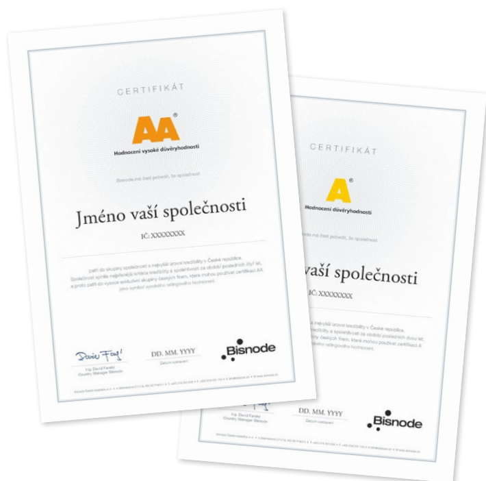
Mezinárodní ocenění AA a A Náhled tištěného certifikátu