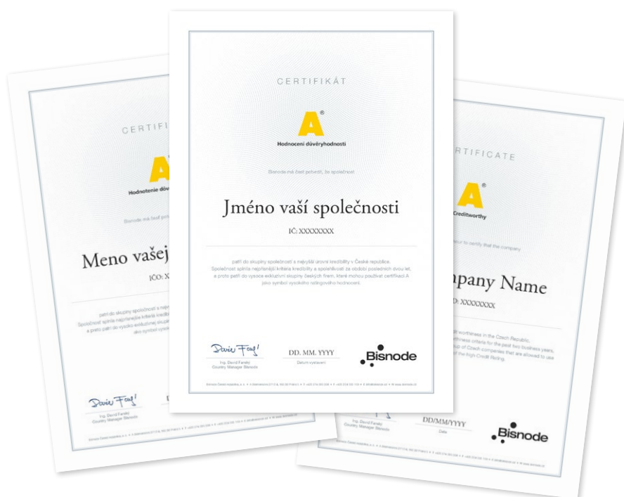
Mezinárodní ocenění A Náhled tištěného certifikátu